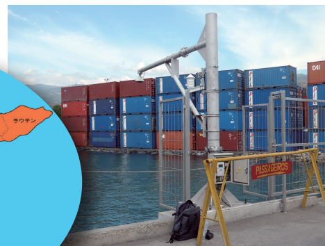
超音波送受波器 設置状況