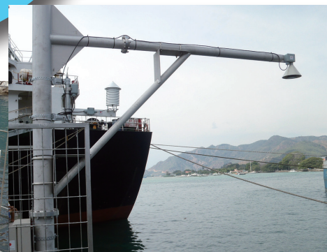
超音波送受波器 設置状況