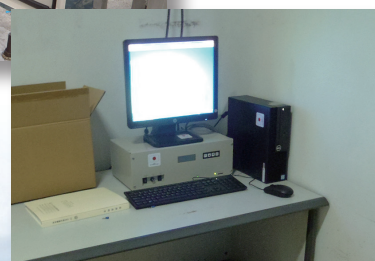
データ収集表示装置 リアルタイムデータ・グラフ・帳票表示・データ保存など