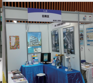
2017”よい仕事おこし”フェア